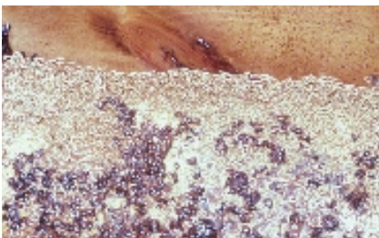
Abb. 7: Ein vom Kleinen Beutenkäfer zerstörtes Bienenvolk. Das Bodenbrett ist mit Hunderten von erwachsenen Käfern und Larven bedeckt.

Höhe des Schadens am Bienenvolk hängt entscheidend von der Anzahl der Käferlarven und der Verteidigung des Volkes ab. Schwache Völker europäischer Bienenunterarten können innerhalb von zwei Wochen vernichtet werden. Sind die Käferlarven in großen Mengen vorhanden, ist das Überleben eines Bienenvolkes stark gefährdet. Nach zehn bis 29 Tagen haben die Larven ihr Wachstum abgeschlossen und sind ca. zehn bis zwölf Millimeter lang. Fehlt Honig in der Nahrung, kann