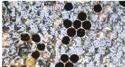
Abb. 8: Typisches Schadensbild durch Larven des Kleinen Beutenkäfers – die Waben „verschleimen“

„Fraßmehl“ (kleine Bruchstückchen von Waben), ähnlich wie bei einem Wachsmottenbefall, vorkommen. Ansonsten haben die befallenen Waben ein „schleimiges Aussehen“ (Abb. 8).