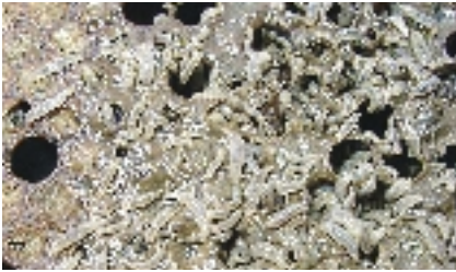
Abb. 6: Larven des Kleinen Beutenkäfers minieren in einer Brutwabe.

Höhe des Schadens am Bienenvolk hängt entscheidend von der Anzahl der Käferlarven und der Verteidigung des Volkes ab. Schwache Völker europäischer Bienenunterarten können innerhalb von zwei Wochen vernichtet werden. Sind die Käferlarven in großen Mengen vorhanden, ist das Überleben eines Bienenvolkes stark gefährdet. Nach zehn bis 29 Tagen haben die Larven ihr Wachstum abgeschlossen und sind ca. zehn bis zwölf Millimeter lang. Fehlt Honig in der Nahrung, kann