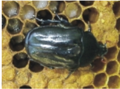
Abb. 2: Der Große Beutenkäfer ( Hyplostoma fuliginosus ) – ein weiterer Bienenschädling, der bislang auf Afrika beschränkt ist.

Er wird „Kleiner Beutenkäfer“ genannt, um ihn vom „Großen Beutenkäfer“ (Abb. 2), der bislang nur in Afrika bekannt ist, zu unterscheiden. Im Gegensatz zum Großen Beutenkäfer, verursa-