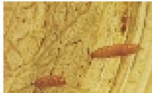
Abb. 9: Ausgewachsene Wanderlarven des Kleinen Beutenkäfers können relativ weite Strecken, bis zu 30 m, zurücklegen, um geeignete Stellen für ihre Verpuppung zu finden.

Die ausgewachsenen Larven erreichen das sog. Wanderstadium und versammeln sich oft in großen Mengen auf dem Bodenbrett und in den Wabenecken, bevor sie sich aus den Beuten hinausbewegen. Die Wanderlarven (Abb. 9) bewegen sich auf das Licht am Stockeingang zu, verlassen die Beute und bohren sich meist in ►